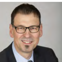
Mathias Stölzle, Erster Bürgermeister Gemeinde Roggenburg